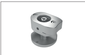
Adapter für Satelec US-Handstück Newtron Slim