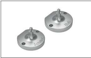
Adapter für die Ultraschallspitzen von EMS und Satelec

NEU: Die sichere und von den Herstellern zugelassene Aufbereitung für ZEG Spitzen (EMS, Satelec)*, Ultraschall-Handstücken (EMS, Satelec)* sowie Pulverstrahlgeräten (EMS)*. Jetzt möglich mit dem Flex-Deckel.