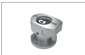
Adapter für Satelec US-Handstück Newtron