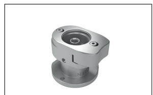
Adapter für Satelec US-Handstück Newtron LED