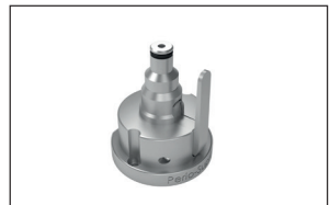
Adapter für EMS Air-Flow Handy-Düsen (3.0 Plus, 3.0 Perio, 3.0)